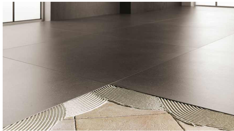
Verlegen auf einen alten Fliesenbelag